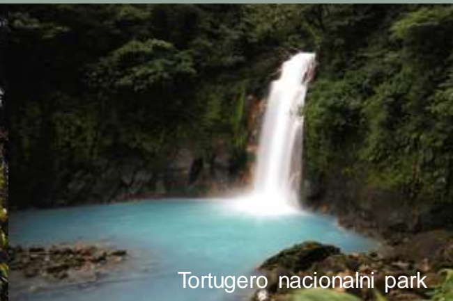
Tortugero nacionalni park